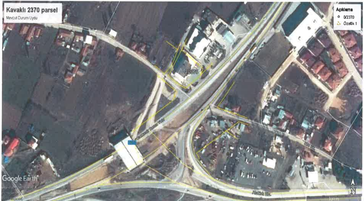
Planlama Alanı Uydu Görüntüsü Paftası

Plan değişikliği yapılan parsel, konum olarak önemli bir kavşak bölgesinin hemen öncesinde ve ulaşılabilirliği yüksek nitelikte olan bir konuma sahiptir.