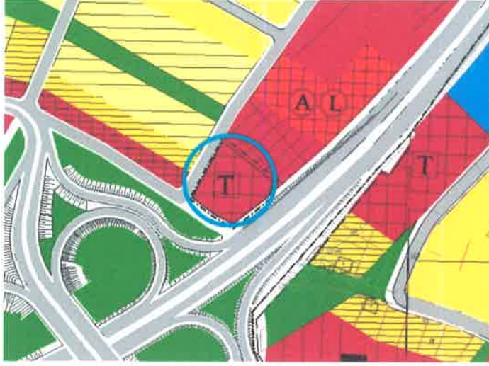
1/5000 TatkovaklıRevizyon Nazım Plan Örneği

2370 nolu parsel yürürlükteki onaylı, 1/5000 ölçekli TatkovaklıRevizyon Nazım İmar Planında, “ Ticaret Alanı ” olarak düzenlenmiştir.